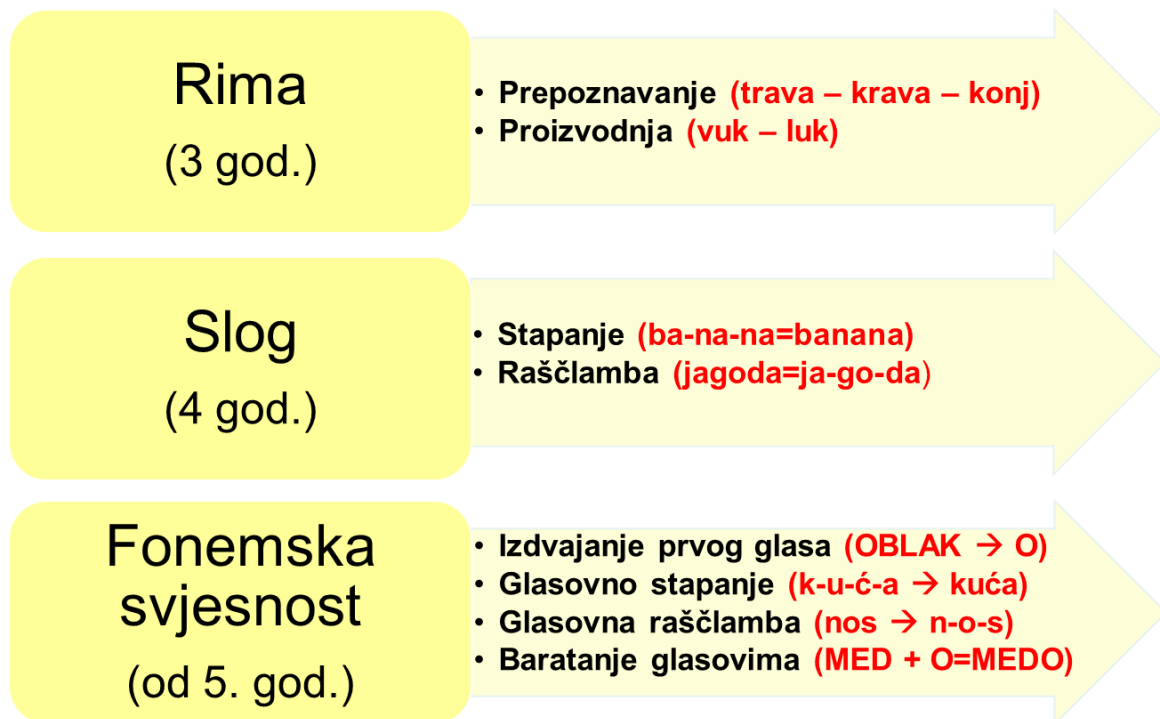
Slika 2. Razvoj fonološke svjesnosti

Većina djece spontano usvoji ove predvještine čitanja i pisanja. Međutim, nekoj djeci potrebno je više poticaja i usmjerenih aktivnosti. Važno je imati na umu da djeca najbrže i najlakše uče kroz igru, slikovni materijal, priče i pjesmice pa je pripremu za školu potrebno temeljiti na tom principu. Zajedničke aktivnosti djeteta i roditelja vrlo su važne za cjelokupni razvoj djeteta pa tako i za razvoj predvještina čitanja i pisanja. Čitanjem djetetu od najranije dobi i zajedničkim aktivnostima s različitim tiskanim materijalima dijete usvaja znanja i vještine koje mu otvaraju put ka pismenosti.